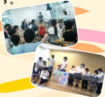
全員で一つの目的に向かって、一致団結!

生活単元学習では、生徒一人一人が主体的に参加し、互いに影響を与え合いながら活動できる授業を目指しています。生徒の興味関心、時期や課題に合わせて設定するテーマや目標に向けて様々な活動に取り組み、達成感や成就感を味わったり、自信や自己肯定感を高めたりし、「人と関わる力、自己決定する力、課題を解決する力」などにつなげていきたいと考えています。