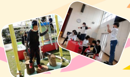
どんな遊びでも楽しいね、愉快活発!