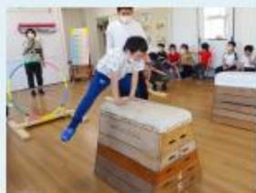
おはよう広場(体育)

※1 諸行事や時期により、重ならないように設定 ※2 不定期で年15回程度実施 ※3 個別課題学習として実施