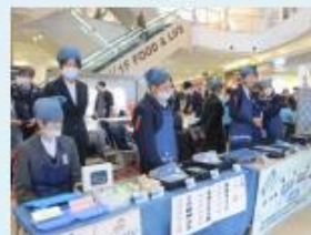
作業製品販売会「冬市」