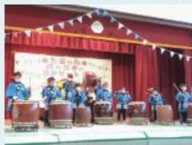
生活単元学習 「音楽発表会」