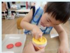
チャレンジタイム