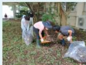
産業現場等における実習