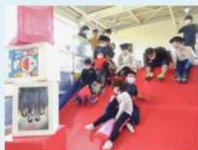
遊びの指導 「わくわく広場であそぼう！」