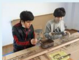
生活単元学習 「みんなのふよう図書館を作ろう」