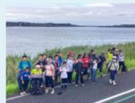
生活単元学習 「高等部学部合宿一歩く合宿一」