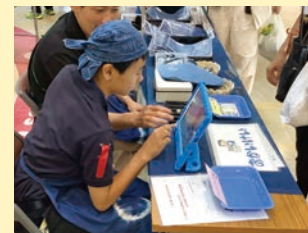
作業製品販売会「夏市」