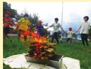
生活単元学習 「ロマンの森にとまろう！」