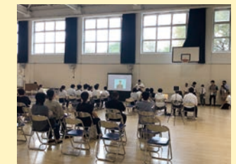
産業現場等における実習 「実習激励会」