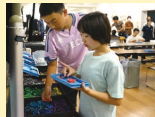
生活単元学習 「溶かして作ろう 虹色クレヨン！」