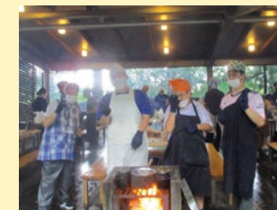
生活単元学習 「学部合宿-野外調理-」