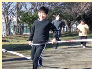
おはよう広場(体育)

※1 諸行事や時期により、重ならないように設定 ※2 不定期で年15回程度実施 ※3 個別課題学習として実施