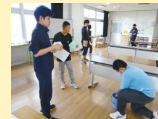
職業/家庭「清掃検定」