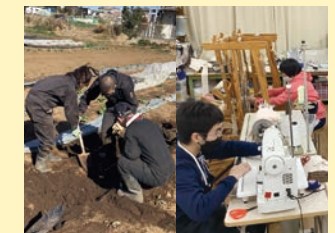
作業学習 「農耕班/木工芸班」