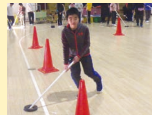
保健体育 「フロアホッケー」