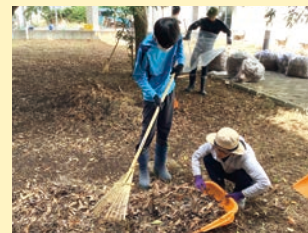
産業現場等における実習