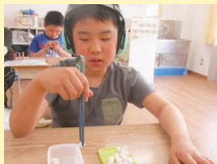
チャレンジタイム