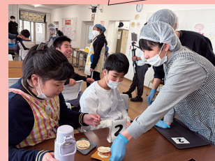
生活単元学習 「おいしく作って食べてもらおう!サンキューカフェ」