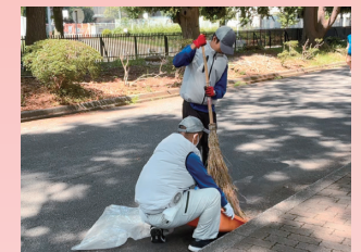
産業現場等における実習