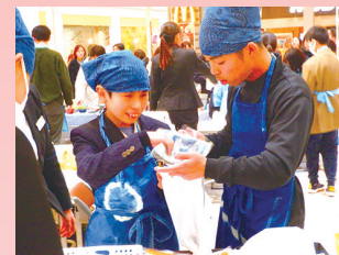
作業学習あいぞめ班 「冬市」