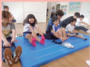
おはよう広場(体育)