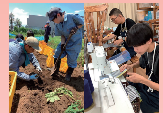
作業学習 「農耕班／木工芸班」