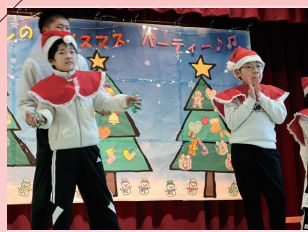
生活単元学習 「音楽発表会」