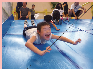
遊びの指導 「みんなであそぼう!わくわくランド」