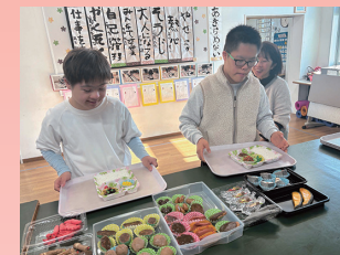
職業／家庭 「調理実習」