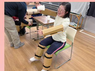
総合的な学習の時間発見タイム 「からだのしくみ」