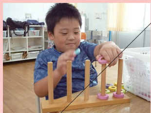
チャレンジタイム