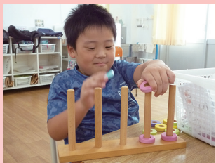
チャレンジタイム