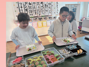
職業／家庭 「調理実習」