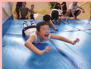
遊びの指導 「みんなであそぼう!わくわくランド」