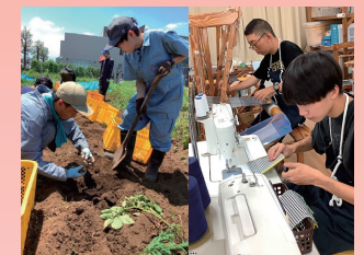
作業学習 「農耕班／木工芸班」