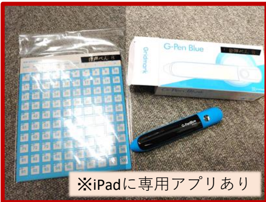
※iPadに専用アプリあり