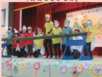
生活単元学習 「音楽発表会」