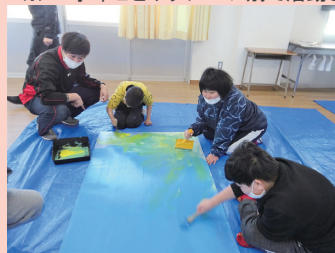
生活単元学習 「水族館の生き物を調べて、作って、発表しよう!」