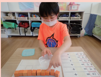
チャレンジタイム