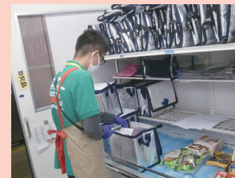
産業現場等における実習