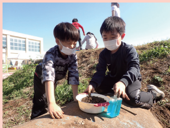
遊びの指導 「あおぞらひろば」