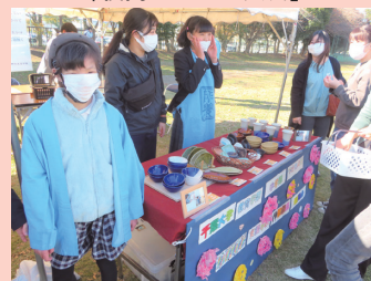
作業製品販売会「ふよう祭」