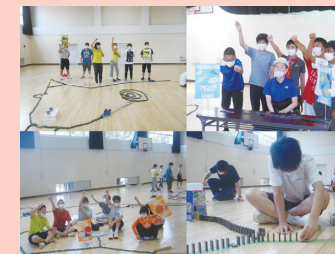
生活単元学習 「千葉県ドミノチャレンジ」