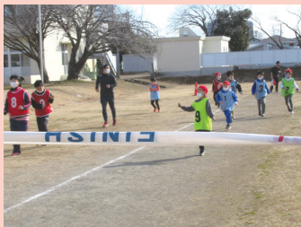
おはよう広場(体育)