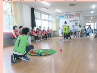
体育 「校内スポーツ大会」