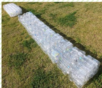
ぺっとぼとるのみち