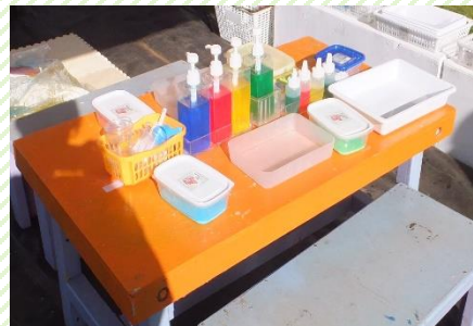
いろみず・すらいむ